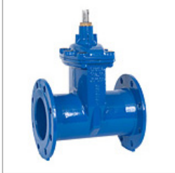
Serie: HM-GN-FF t/m DN600 PN10 | PN16