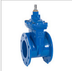
Serie: LM-GN-FF t/m DN600 PN10 | PN16