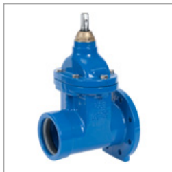
Serie: HM-GN-MF PN10