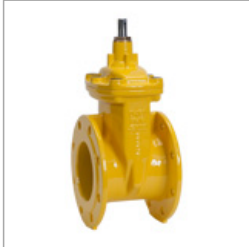
LM-GN-FF t/m DN600 GAS PN10 | PN16