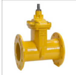
Serie: HM-GN-FF t/m DN600 GAS PN10 | PN16