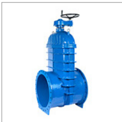
Serie: HM-GN-FF vanaf DN700 PN10 | PN16